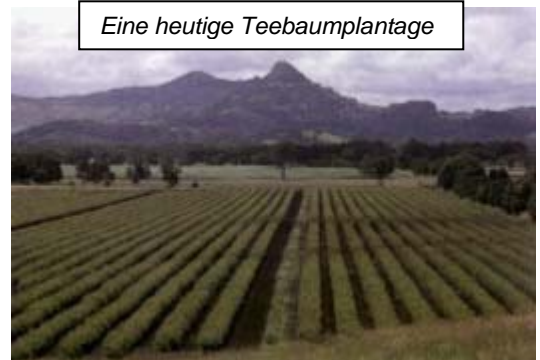
Eine heutige Teebaumplantage

Geerntet wird einmal pro Jahr. Die 1,5 bis 2 Meter großen Bäumchen werden Vollständig abgeschnitten. Durch schwankendes Klima (z.B. Dürreperioden oder Regenzeiten) muss manchmal bis zu 3 Monate früher oder später geerntet werden.