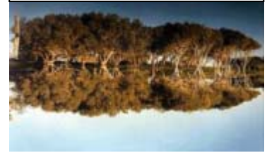
Der Teebaum in freier Natur

Der Teebaum ( griech. Melaleuca alternifolia ) wächst in Australien. Schon vor Jahrtausenden erkannten die Aborigines, die heilende Kraft des Teebaumöls. Sie zerdrückten die Blätter, oder legten sie auf heiße Steine um die freiwerdenden Öldämpfe zu inhalieren. Sogar Verbände aus einem Brei von zermalnten Zweigen und Blättern stellten sie her. Nach der Entdeckung Australiens 1770, brachte James Cook das Teebaumöl nach Europa. Der Name Teebaum könnte vermutlich daher stammen, dass Cooks Mannschaft Tee aus einer Unterart des Teebaumes nämlich Melaleuca quinquenervia gemacht hat.