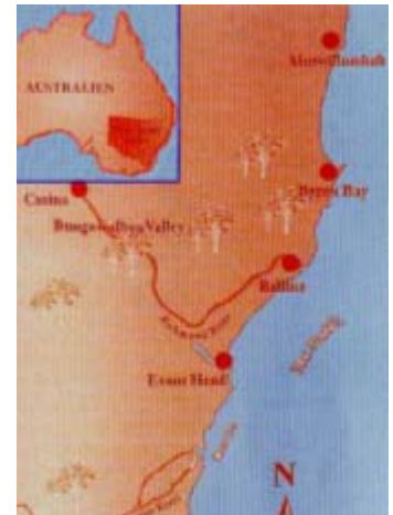
Das natürliche Vorkommen des Teebaumes

Ursprünglich wuchs der Teebaum Melaleuca alternifolia nur an der Ostküste Australiens.